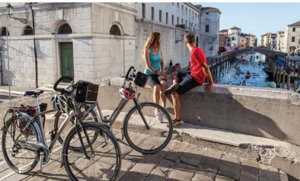
1 Chioggia, staro mestno jedro